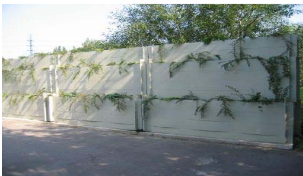
Obrázek 2: Absorpční dekorativní protihluková stěna